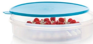
Recipiente Redondo Cabe una tarta sencilla de 9"/22.5 cm. 85257 $27 $19