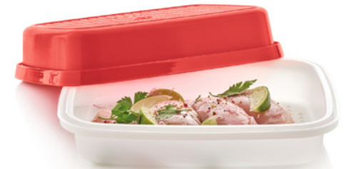
Recipiente Season-Serve® 12.5 x 10.5 x 4.5" / 31.8 x 26.7 x 11.5 cm. 85252 $27 $19

¡Pregúntale a tu consultor Tupperware® sobre más ofertas increíbles del Viernes Negro!