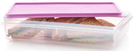
Recipiente Snack-Stor® Grande 12 x 9 x 2½" / 30 x 23 x 6 cm. 85262 $37 $26