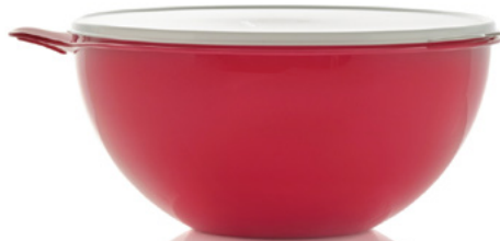
Tazón Thatsa® 32 tazas/7.8 L. 85256 $30 $21