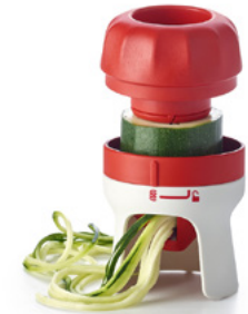
Espiralizador Manual © Convierte vegetales como calabacitas, zanahorias y pepinos en fideos con forma de espiral. 85263 $20 $14