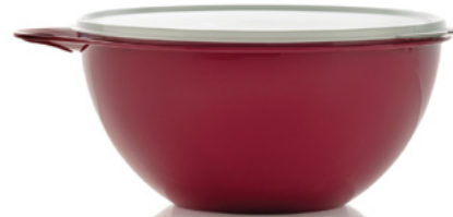
Tazón Thatsa® Mediano 19 tazas/4.5 L. 85251 $25 $17