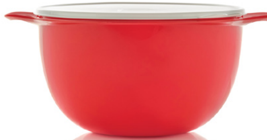
Mega Tazón Thatsa® 42 tazas/10 L. 85259 $35 $25

DISPONIBLE DESDE EL 23 DE NOVIEMBRE A LAS 12 P. M., HORA DEL ESTE, HASTA EL 28 DE NOVIEMBRE DE 2022 A LAS 11:59 P. M., HORA DEL ESTE